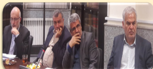
دویست و دهمین جلسه شورای پژوهشی پژوهشکده اعجاز قرآن